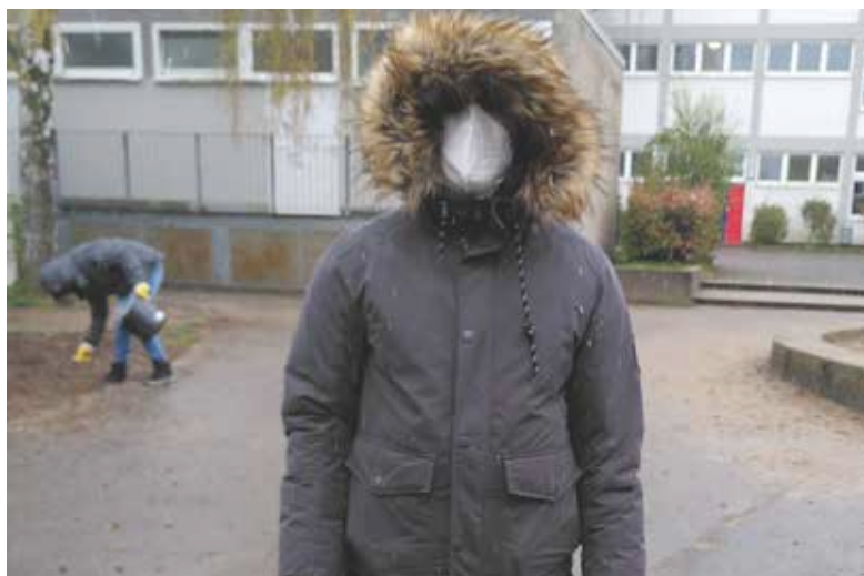
Auch Sidar hilft mit.