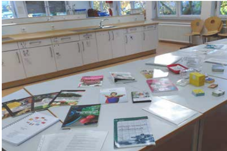
Materialien liegen bereit.