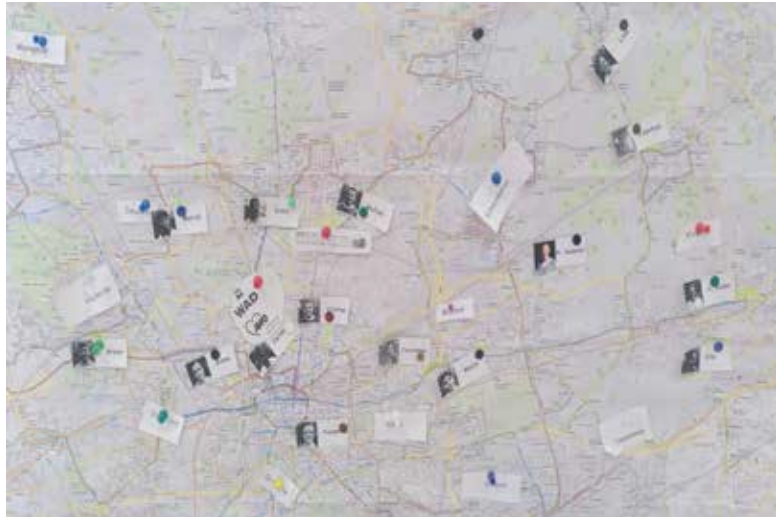
Die Standorte der Wohnungen der Schülerinnen und Schüler wurden in der Karte markiert.