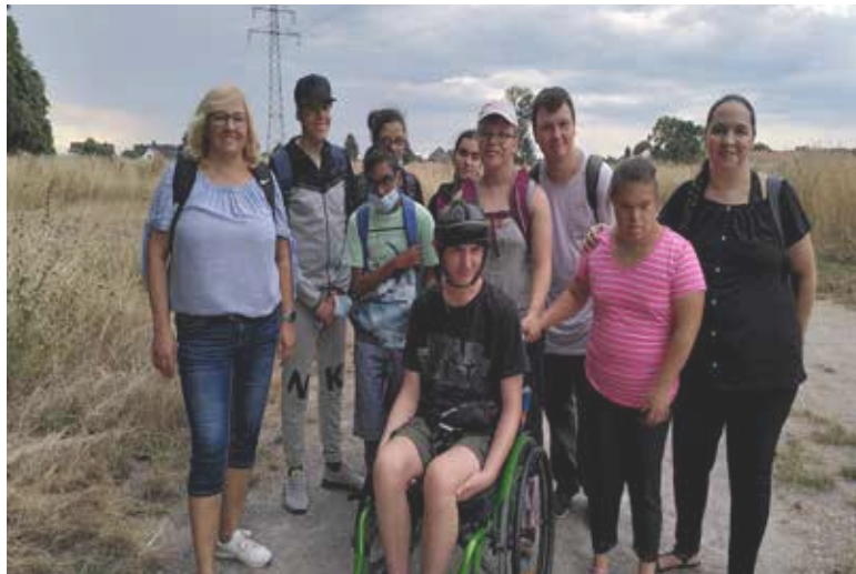
Wir sind auf dem Weg in den Wald.