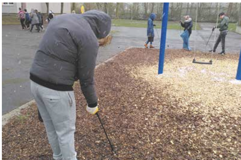
Die Schülerinnen und Schüler reinigen den Schulhof.