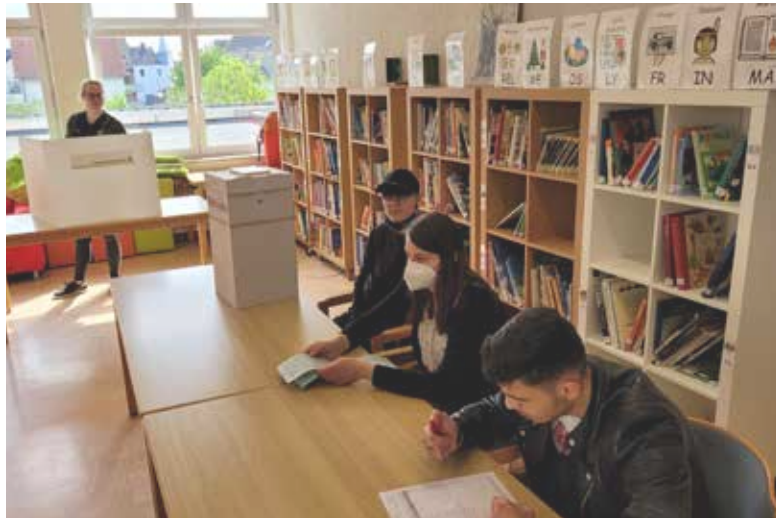
Das Wahllokal wurde in der Schülerbücherei eingerichtet.