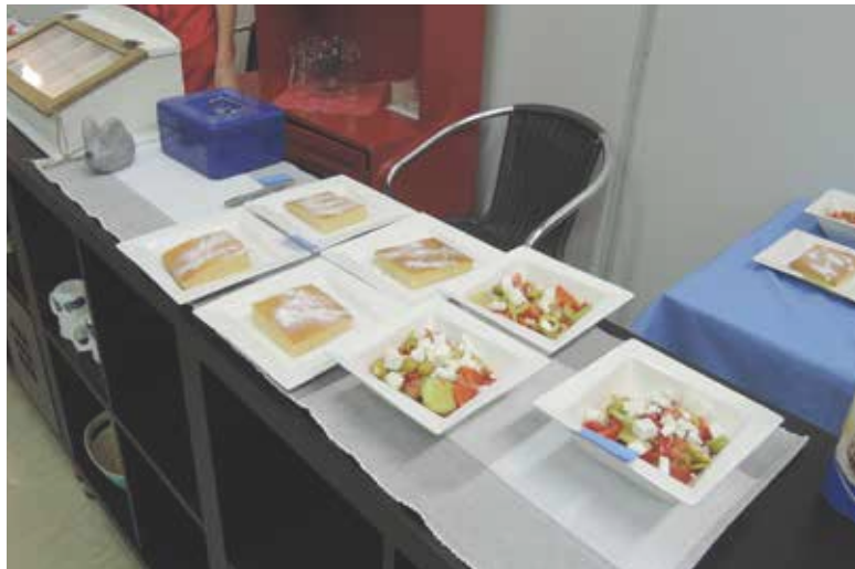
Die Speisen sind angerichtet.