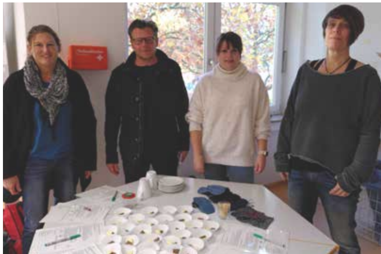
Die Schokodetektive machen sich an die Arbeit.

Im Rahmen einer Lehrerfortbildung wurden Materialien für den Hauswirtschaftsunterricht und die Verbraucherbildung vorgestellt.