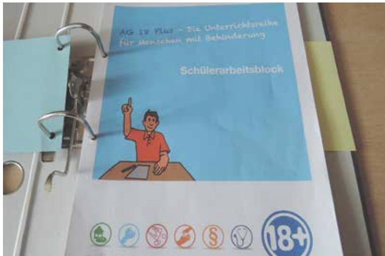
Unterlagen werden in einer Mappe gesammelt.

Die AG 18+ ist ein Angebot für die leistungsstarken Schülerinnen und Schüler der Abschlussklassen. Hier lernen sie alles über ihre Rechte und Pflichten, die mit ihrer Volljährigkeit verbunden sind. Dazu gehört u.a. das Ausfüllen von Anträgen, was muss ich bei Verträgen (z.B. Handy, Mietvertrag) beachten und wo kann ich mir Unterstützung holen. Die Schülerinnen und Schüler festigen ihr Wissen, indem sie die entsprechenden Arbeitsblätter zu den Themen Rechte, Verträge und Finanzen bearbeiten.