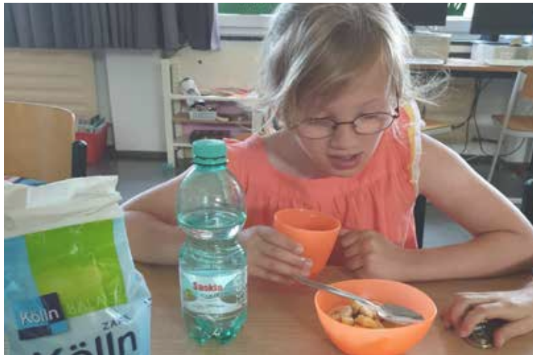
Auch in der Primarstufe wird das gesunde Frühstück gefördert.