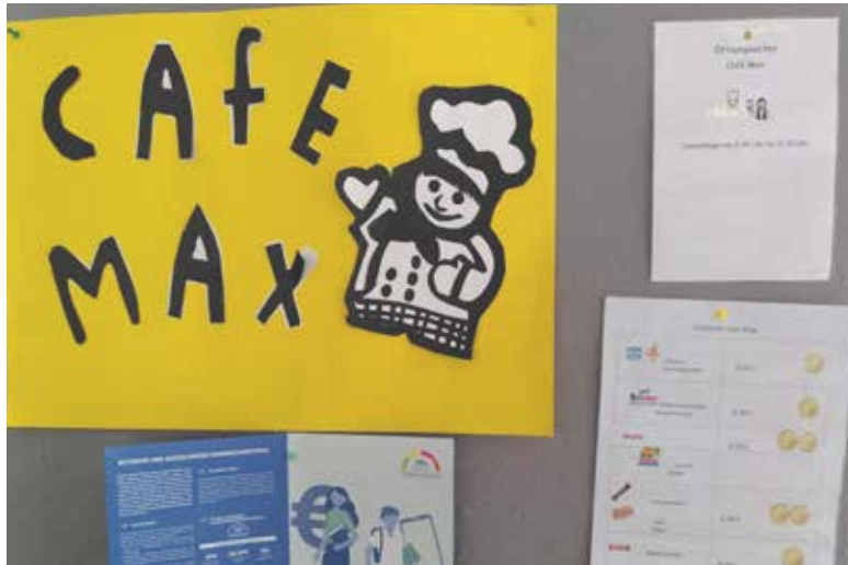
Das Café MAX ist geöffnet.