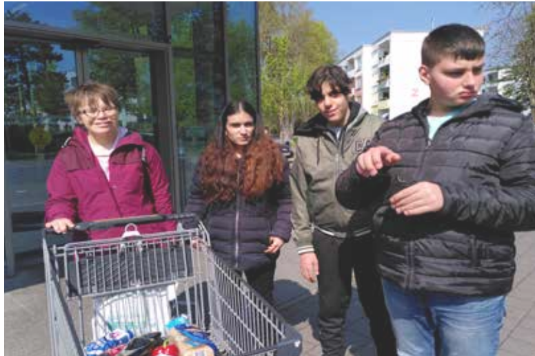
Die 10B kauft die Lebensmittel für das Frühstück ein.